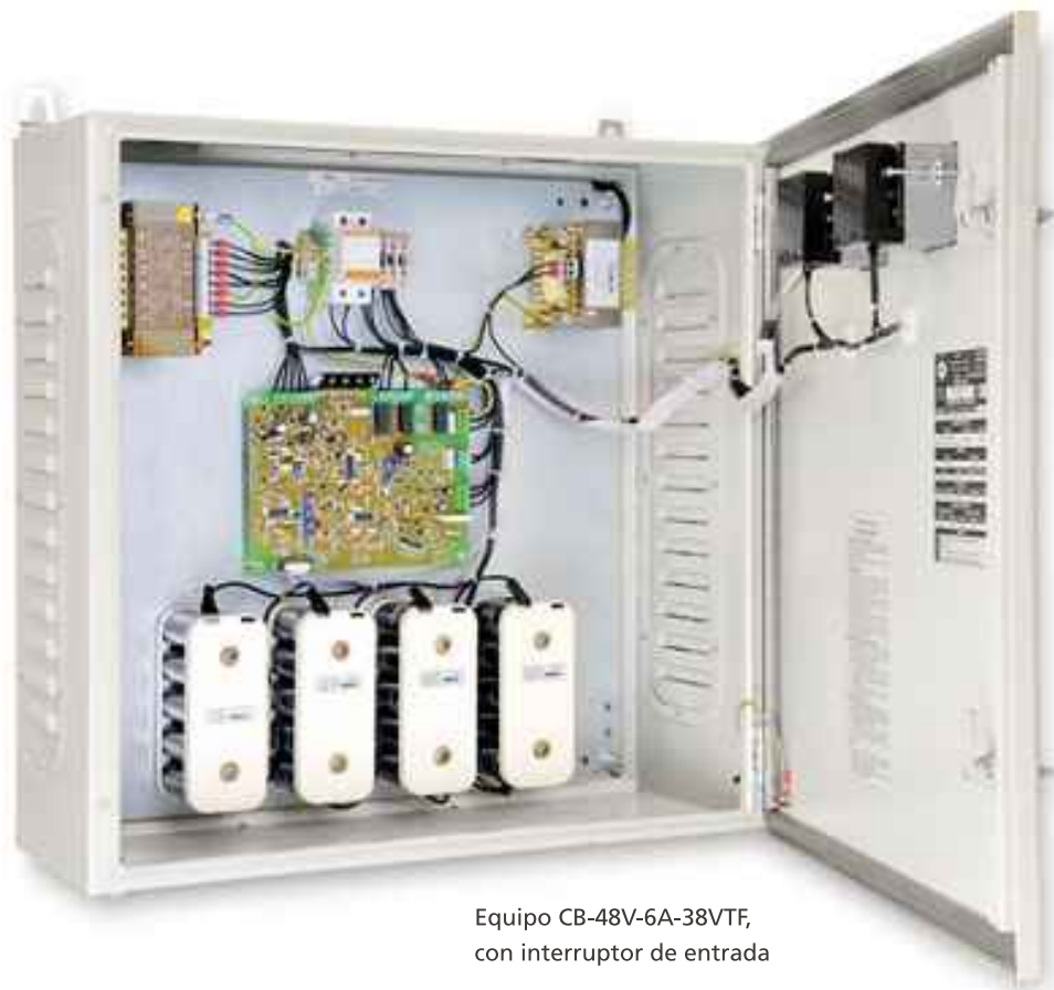
Equipo CB-48V-6A-38VTF, con interruptor de entrada

La batería está conectada en la salida del equipo, por lo que la utilización no sufre ningún corte al faltar la tensión de red.