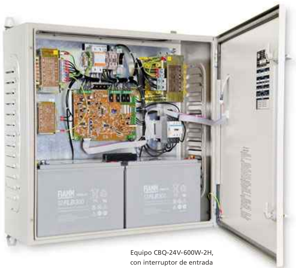
Equipo CBQ-24V-600W-2H, con interruptor de entrada

y tensión continua de salida en su ausencia. La tensión de salida es de 24V, si bien pueden establecerse otros valores.