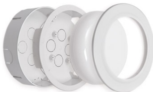
CEDOME DOME-O MADOME-B

■ Baterías de níquel-cadmio de alta temperatura y fuente de luz constituida por un led de 1W de potencia y 100.000 horas de vida.